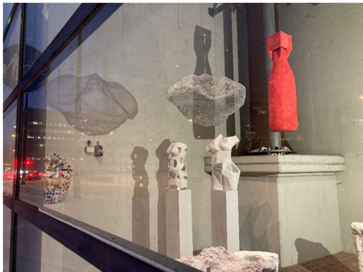
Kuva: Kuvanveiston mestarikurssin näyttely Via Kaapelissa joulukuussa

Käytävägalleria: Käytävägalleriassa pidetään vuorovuosin näyttely kuvataidekoulun ja kurssikeskuksen kesken, ja vuonna 2023 oli kurssikeskuksen vuoro. Näyttelyyn osallistuivat seuraavat ryhmät: Torstai on toivoa täynnä, Metalligrafiikan työpaja sekä Vesiliukoiset tekniikat.