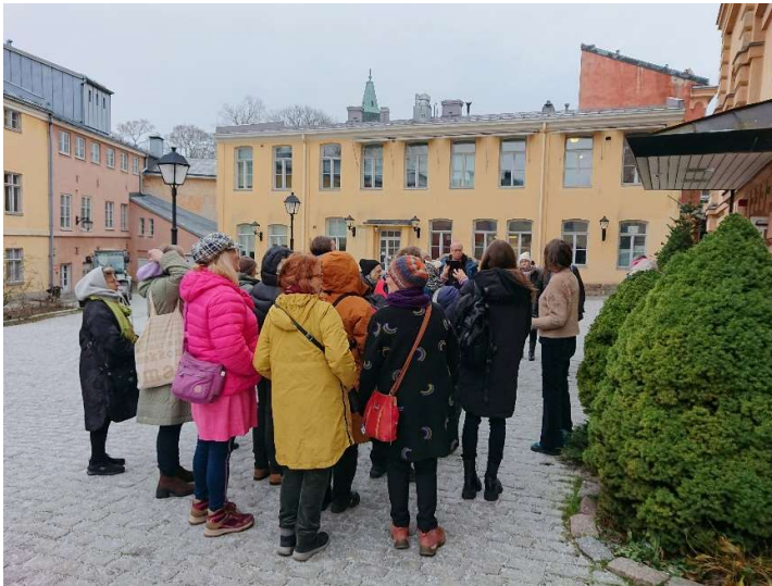
HTSn jäsenten tyhy-päivää vietettiin Turussa marraskuussa 2023.

Vuoden aikana jäsenistölle lähetettiin kuukausittain sähköinen jäsenkirje (11 kpl). Jäsenkirjeissä tiedotettiin ajankohtaisista asioista, esim. projekteista, apurahoista sekä näyttelyiden hakuajoista, ja jaettiin seuran omia työnhakuilmoituksia ja uutisia toimipisteiden kuulumisista, avajaisista, kurseista ja tapahtumista. Jäsenkirjeet sisälsivät myös hallituksen puheenjohtajan tervehdyksen, jossa hän muun muassa tiedotti hallituksen toiminnasta ja ajankohtaisista taidekentälle ja jäsenistölle tärkeistä asioista.