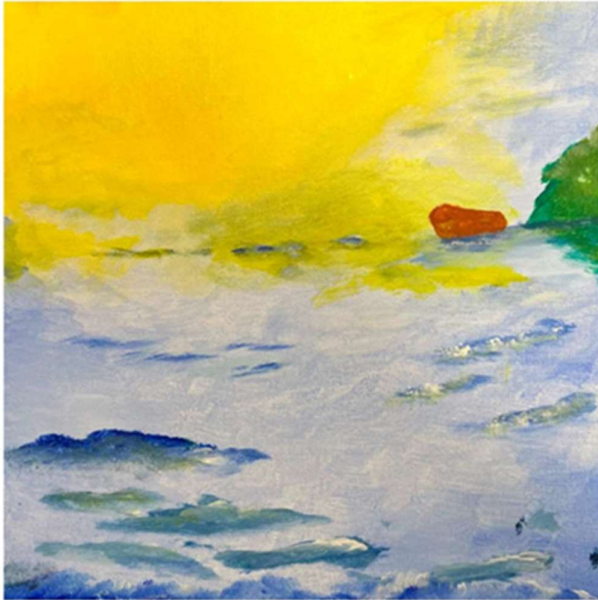
Pirjo L: 30x30 cm, akryyli kankaalle, 2023

Myllypuron seniorikeskuksen Tauko- Galleriatilassa ikääntyneiden kuvataide- ja kirjoitustyöpajanäyttely toukokuussa 2023 (yhteistyö Performance Sirkusyhdistyksen kanssa)