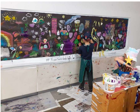
Kuva: Taiteiden yö 17.8.2023

Vuosi 2023 oli Helsingin Taiteilijaseuran kuvataidekoulun 34. toimintavuosi. Kuvataidekoulussa opiskeli kevätlukukaudella 350 oppilasta ja syyslukukaudella 386 oppilasta. Syyslukukaudella auenneet kolme uutta toimipistettä toivat koululle 60 oppilasta lisää. Vuonna 2023 koululla oli opetuspisteitä Kaapelitehtaan lisäksi Tapanilan Hiidenkiven peruskoulussa, Ruskeasuon Rudolf Steiner -koulussa, Aleksis Kiven peruskoulussa, Jätkäsaaren peruskoulussa ja Laajasalon peruskoulussa, joissa toimi kussakin kaksi lasten ja nuorten opetusryhmää.