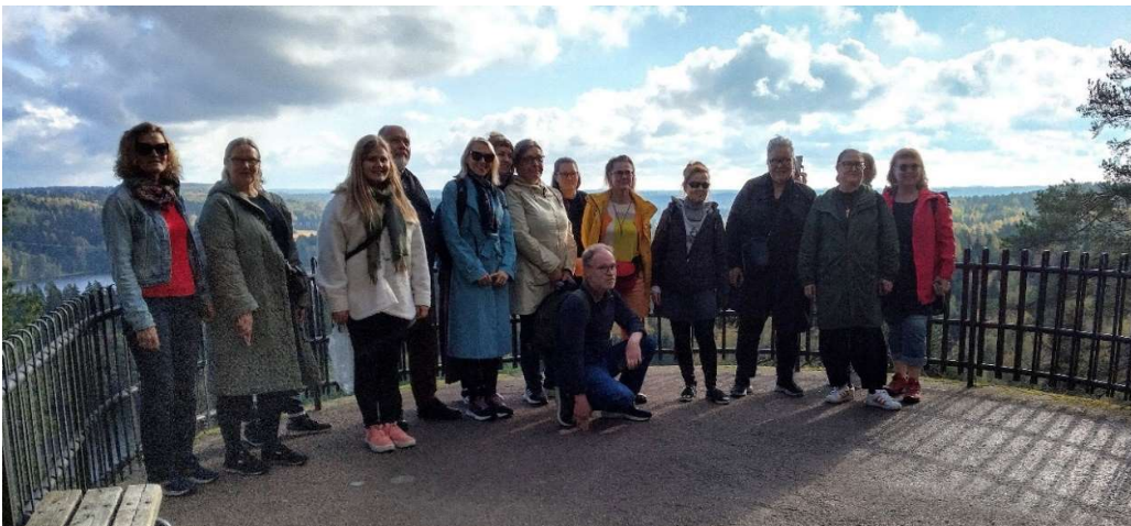
Henkilökunnan virkistyspäivä Hämeenlinnassa syksy 2023.