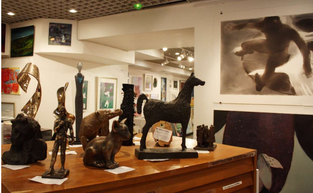
Taidelainaamo: Kuva Taina Kokkonen

Gruppo Software Oy. Ohjelmistokehityshankkeeseen saatiin rahoitus 2019 OKM:n visuaalisen alan välittäjäportaan erityisavustuksesta. Hankkeen puitteissa kehitettiin Suomen taidelainaamoiden käyttöön taidelainojen hallintatyökalu, joka kattaa teosvälityksen toiminnot www-sivujen esittelystä sopimukseen, maksujen käsittelyyn, tilityksiin ja raportointiin. Helsingin Taiteilijaseuran Taidelainaamossa uusi sovellus on ollut kokonaisvaltaisesti teosvälityksen käytössä 2021 alkaen ja monipuolistuvan ohjelman jatkokehittelyä tehtiin edelleen vuonna 2023.