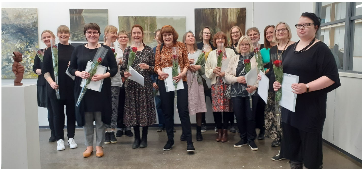
Aikuisten taiteen perusopetuksen 2018–2022 ryhmät päätöstyönäyttelyn avajaisissa todistustenjakotilaisuuden jälkeen 11.5.2022.