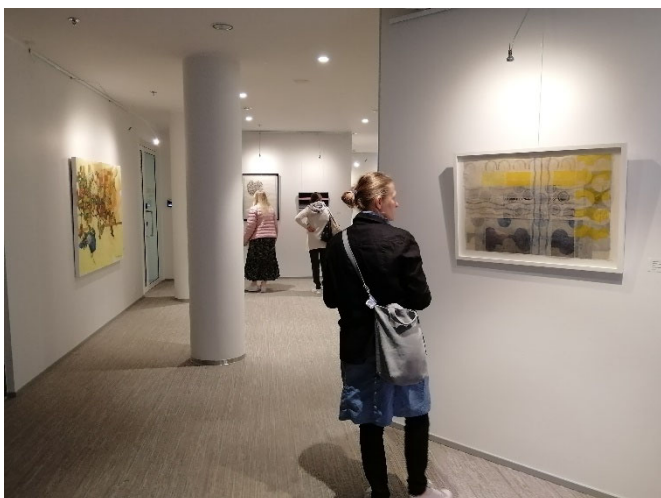
Art Tube 1 -näyttelyn avajaiset 2.9.2022, Kadrioru Plaza galerii, Tallinna.