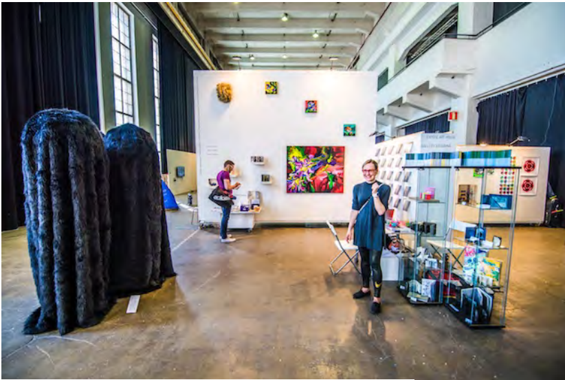
Galleria Katariinan osasto: Art Fair Suomi 2017