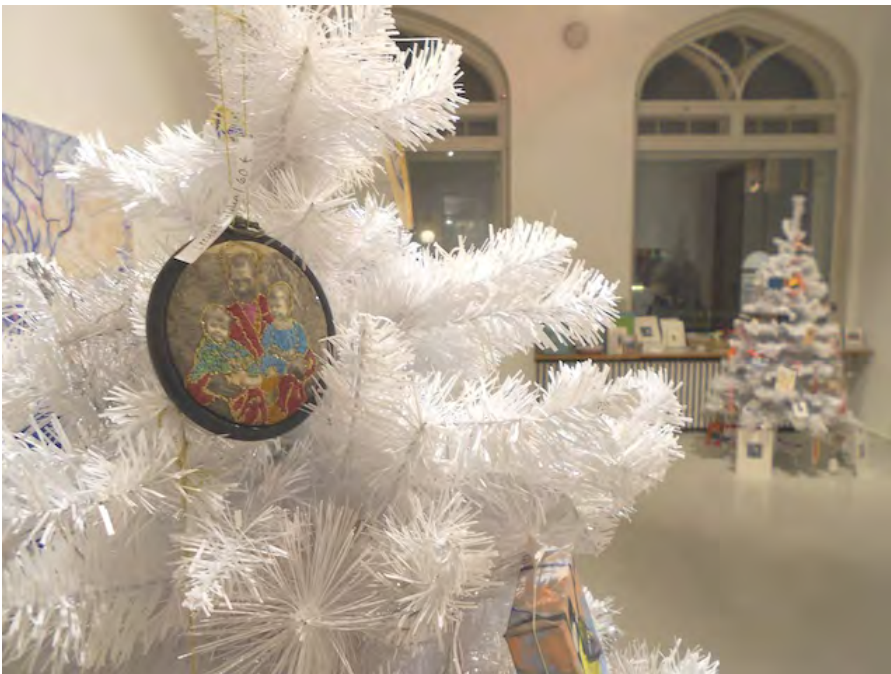
Wunderbaum: Galleria Katariinan perinteinen joulunäyttely