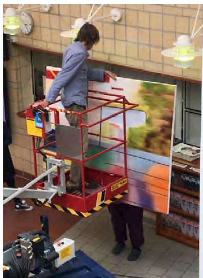
Ripustamassa Jatkuvuus -näyttelyä

Helsingin Taiteilijaseura juhlisti 50 toimintavuottaan monipuolisella näyttelyiden ja tapahtumien sarjalla: näyttelyiden ja tapahtumien Suomi 100 – HTS 50: Kvintetti ja neljä lisäosaa levittäytyi eri puolille Helsinkiä elo-syyskuun aikana. Neljästä lisäosasta kaksi tapahtui Taidelainaamossa ja kaksi Galleria Katariinassa vuoden aikana.