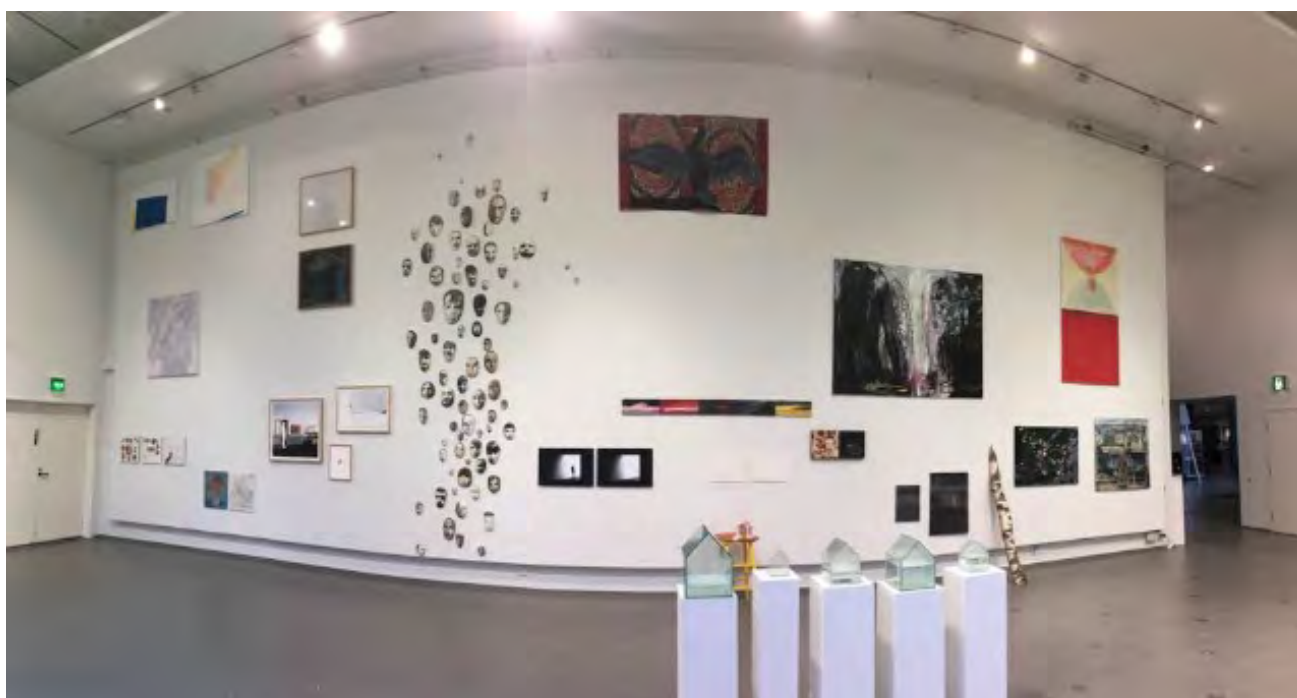
Suomi 100 – HTS 50: Katoavaisuus Kanneltalon galleria